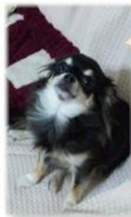
原花様 ももちちゃん