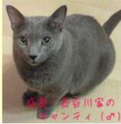
長谷川家の マヤンティ (♂)